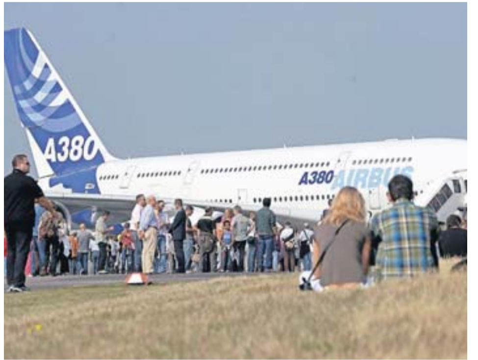
Beim Tag der Luft- und Raumfahrt kommen Besucher so nah an die Flugzeuge heran wie sonst nie.